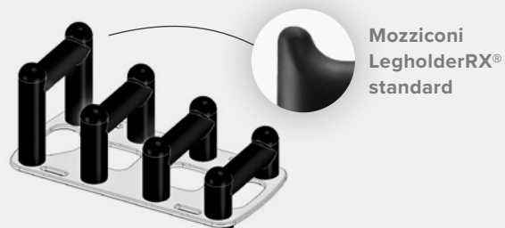
Mozziconi LegholderRX® standard