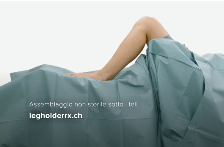
Assemblaggio non sterile sotto i teli legholderrx.ch